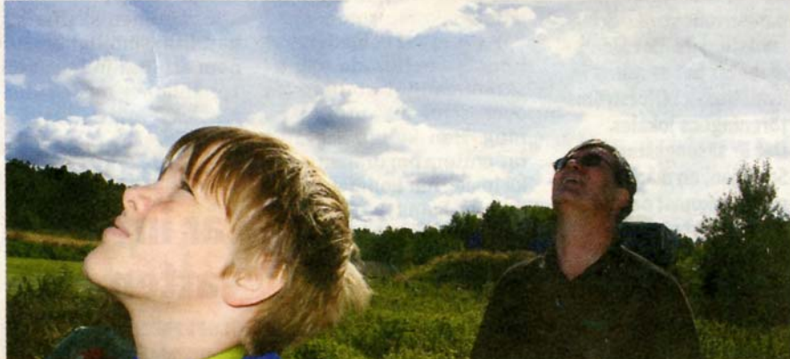
SE UPP. Räckvidden för de små planen är ett par kilometer och det gäller att ha koll på dem och inte flyga rakt in i solen och bli bländad.

- Det är klart att det händer då och då. Det gäller att ha koll på planet